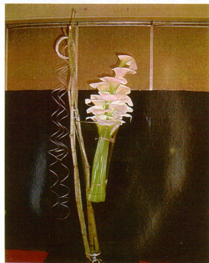
Une œuvre éphémère de Stijn

Si pour certains, il était difficile d'imaginer ce que pouvait être une exposition d'art floral, nul doute qu'après le succès de cette première édition il seront prêts à participer aux suivantes. Alors rendez vous les 20 et 21 mai 2006.