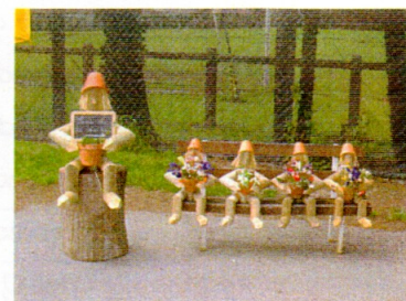
Les « Roger's » à l'accueil