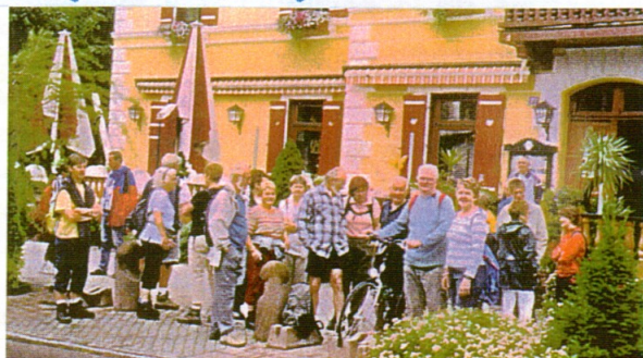
Le départ ....

S'enchaînent visites de sites (lac de Zell am See, cascade de Krimml, gorges de Seisenberg, mines d'argent de Léogang) et randonnées en montagne (alpages, Grossglockner) circuits en vélo dans la vallée.