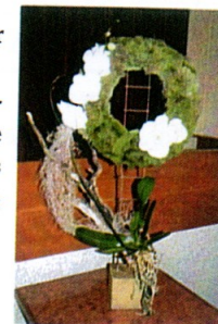
Composition florale réalisée pour l'AG par C Alliet

La sangria bien méritée fut l'occasion d'échanges entre nous, tout en regardant une vidéo concoctée par Claude sur les journées de Plélauff. Le repas qui suivit fut des plus conviviaux, un grand merci à ceux et à celles qui ont préparé les tables et la salle.