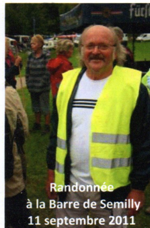
Randonnée à la Barre de Semilly 11 septembre 2011