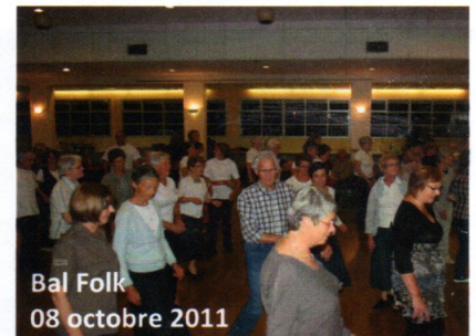
Bal Folk 08 octobre 2011

Les habitués du Cabaret se souviennent de lui car, par 2 fois, il marqua de ses paroles talentueuses et de son empreinte nos soirées «chanson française». Qui d'autre que lui pouvait mieux l'incarner. Allain LEPREST , notre Ami, notre voisin du Cotentin, le «Rimbaud du XXème siècle», a choisi de quitter ce monde l'été dernier. Ayons une pensée pour lui, en réécoutant des chansons de I. Aubret, J. Gréco, J. Ferrat.