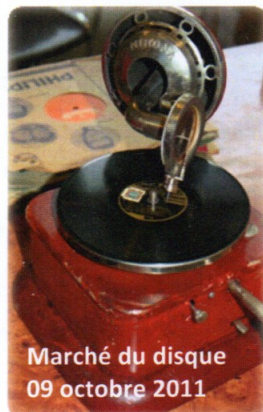
Marché du disque 09 octobre 2011