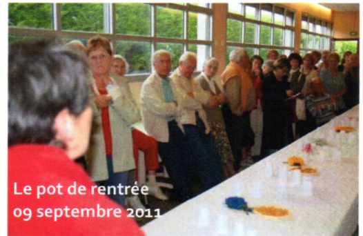
Le pot de rentrée 09 septembre 2011

Depuis le forum du 3 septembre 2011 où notre stand a connu une affluence jamais égalée, toutes les sections ont repris leurs activités ; un trimestre écoulé riche en événements que vous pouvez découvrir sur ces quelques photos.