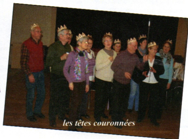
les fêtes couronnées