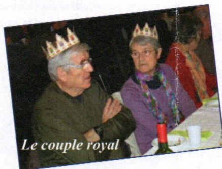
Le couple royal