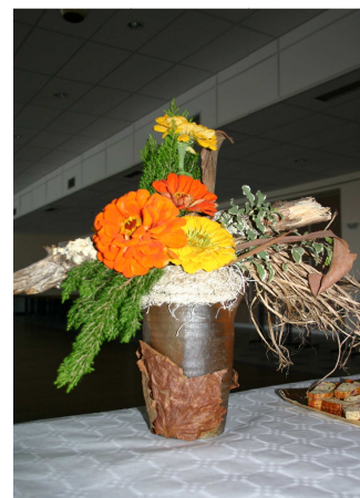
Composition florale réalisée par C. Alliet

ACL a participé comme chaque année à la randonnée, à la confection de crêpes, à la vente d'objets à la Médiathèque confectionnés par l'atelier «Echanges et Rencontres» ainsi que la journée continue organisée par l'Atelier floral.